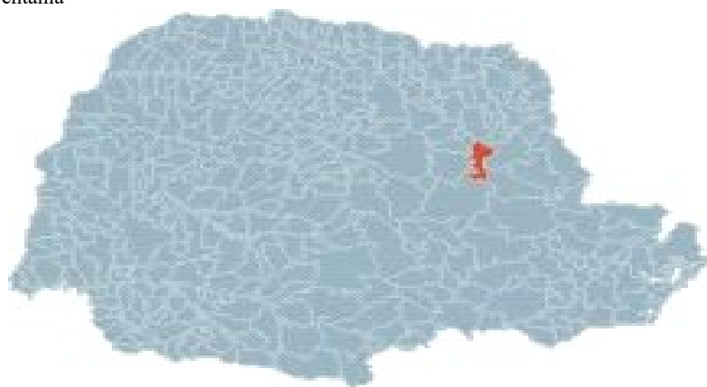
FIGURA 1: Município de Ventania

FONTE: Autor do Histórico: LUIZ CARLOS LUBCZYK